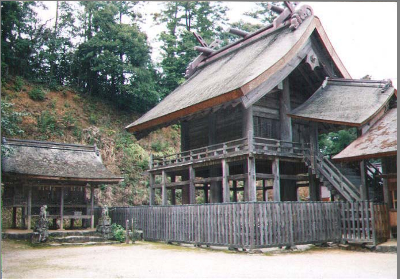
重要文化財 二間社流造 貴布禰稻荷両神社 右；神魂神社本殿