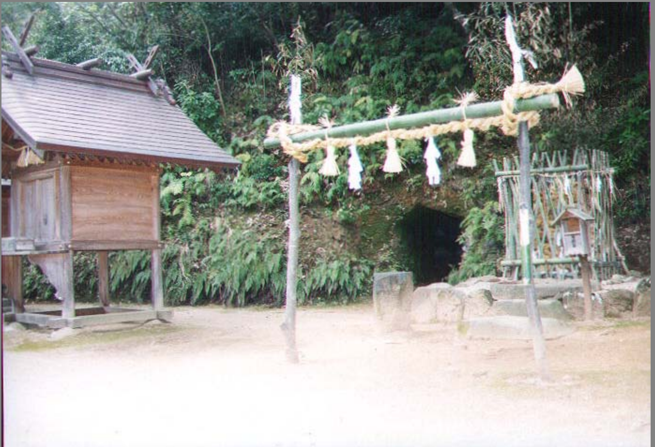
境内社 蛭子社；左・荒神社；右