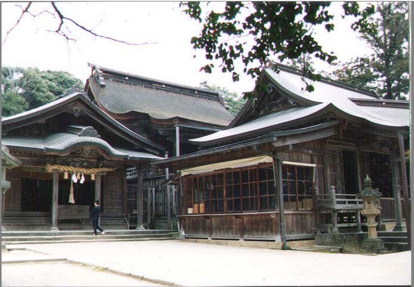
左；武内神社本殿 右；平濱八幡宮の拝殿と本殿