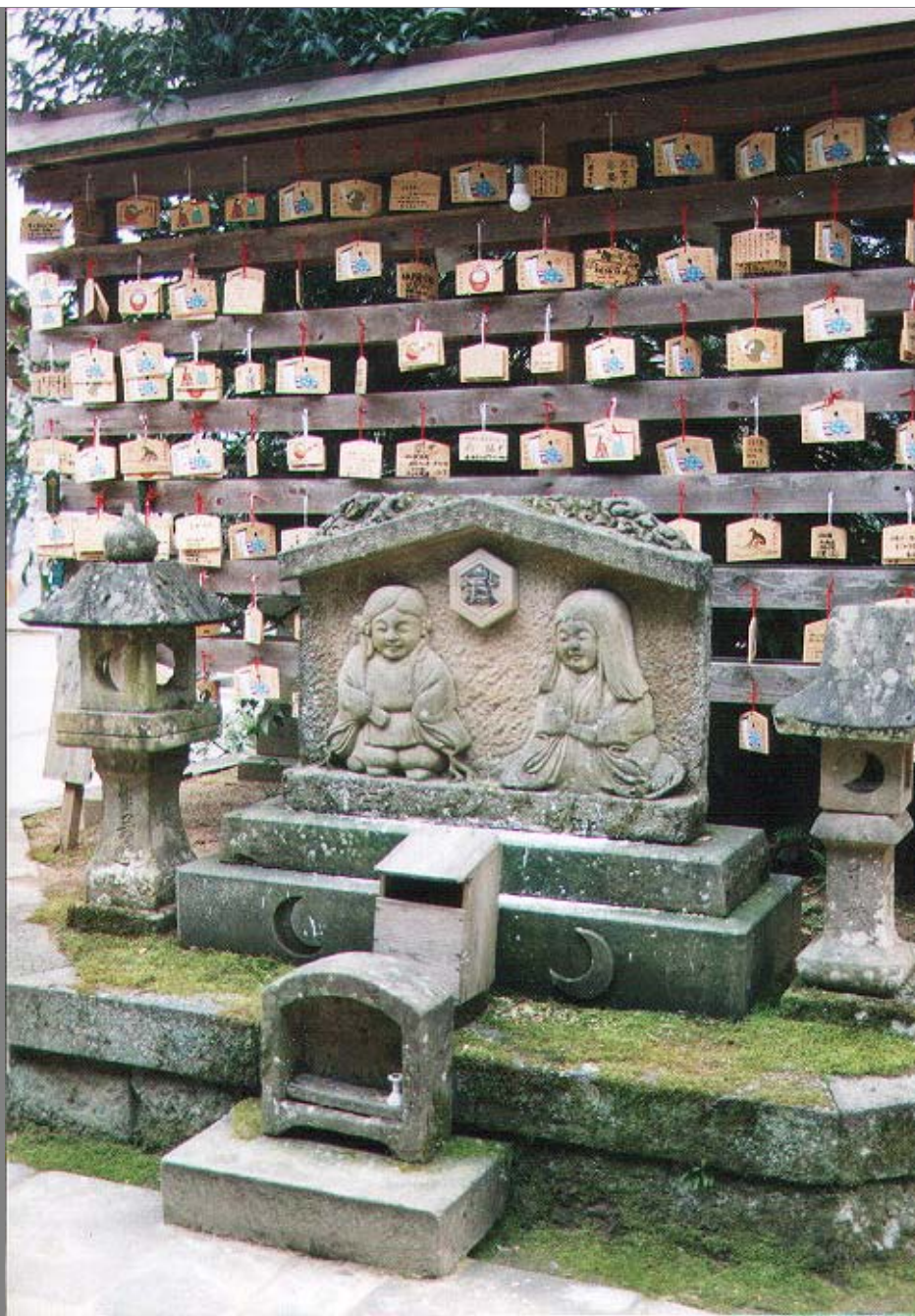
” 武 ” の字が刻印された男女神像