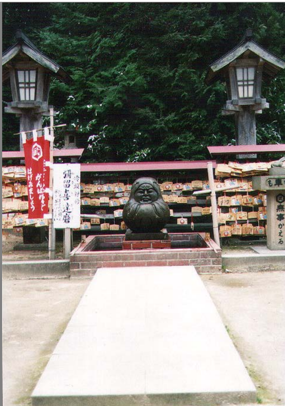
境内のやる気ダルマ