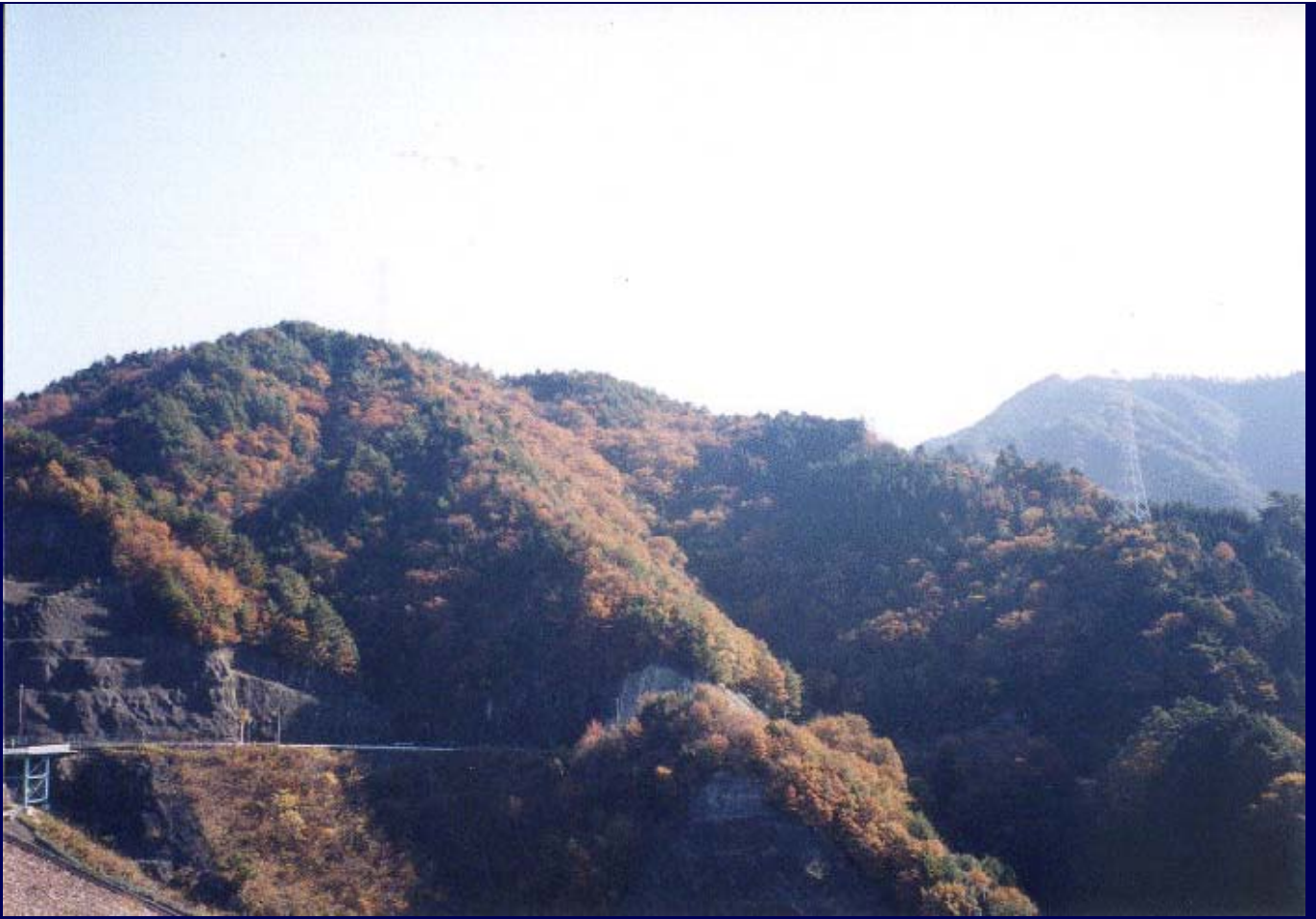
岩屋ダム周辺の山々。