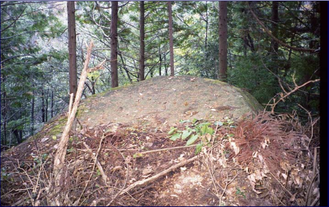
X地点巨石群の中の一つの巨石の頂上部分。