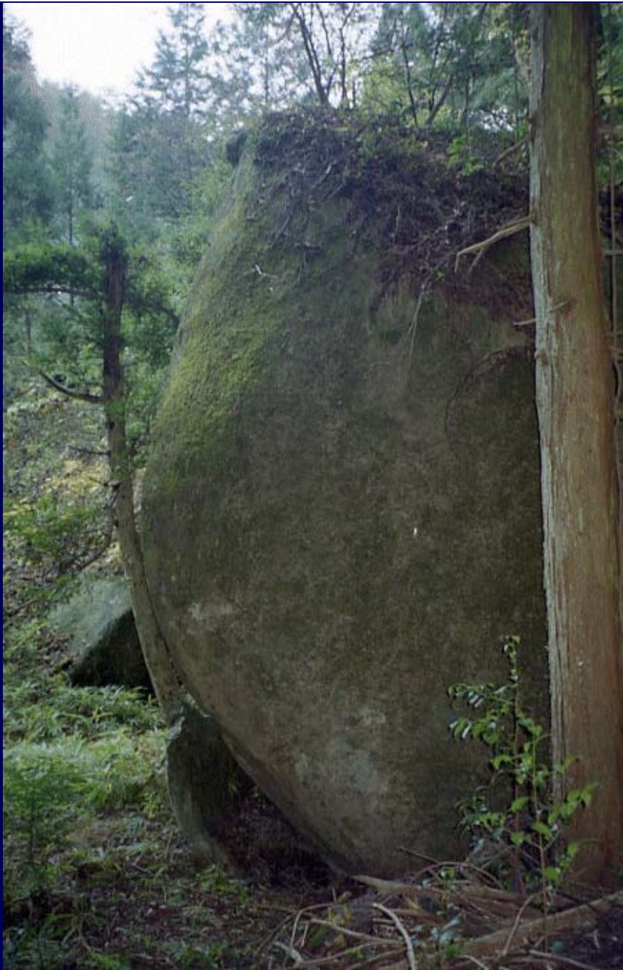
妙見神社の参道脇に合った巨石（だと記憶している）。