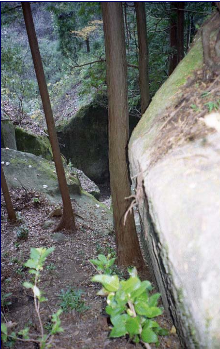
X地点の巨石群密集の様子。X地点最北部の巨石より東南方向を撮影。