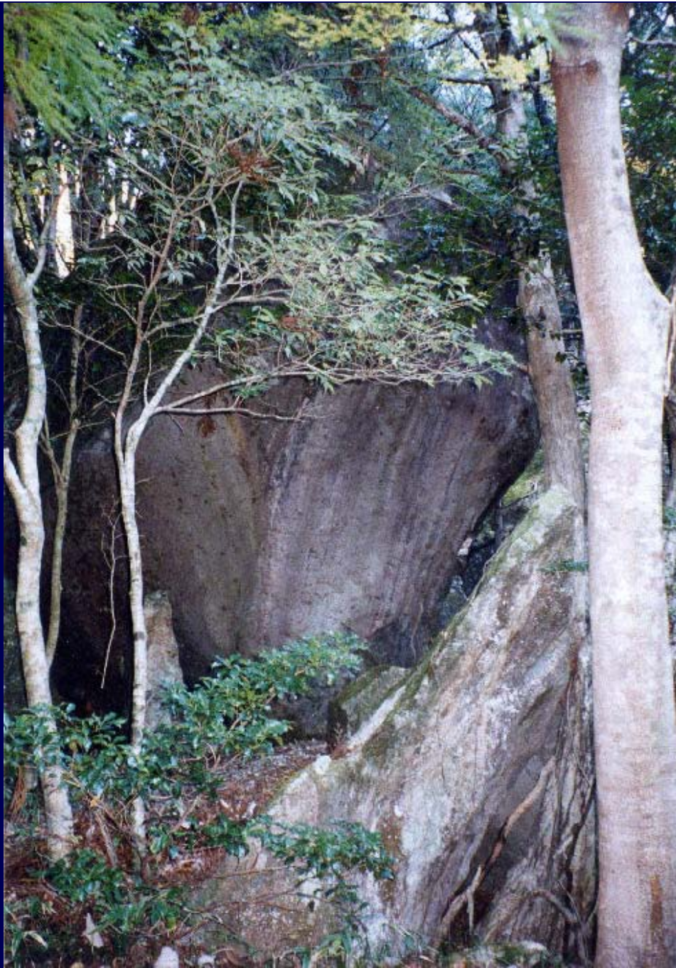
「戦艦のような」巨石を前方から撮影した全体像。