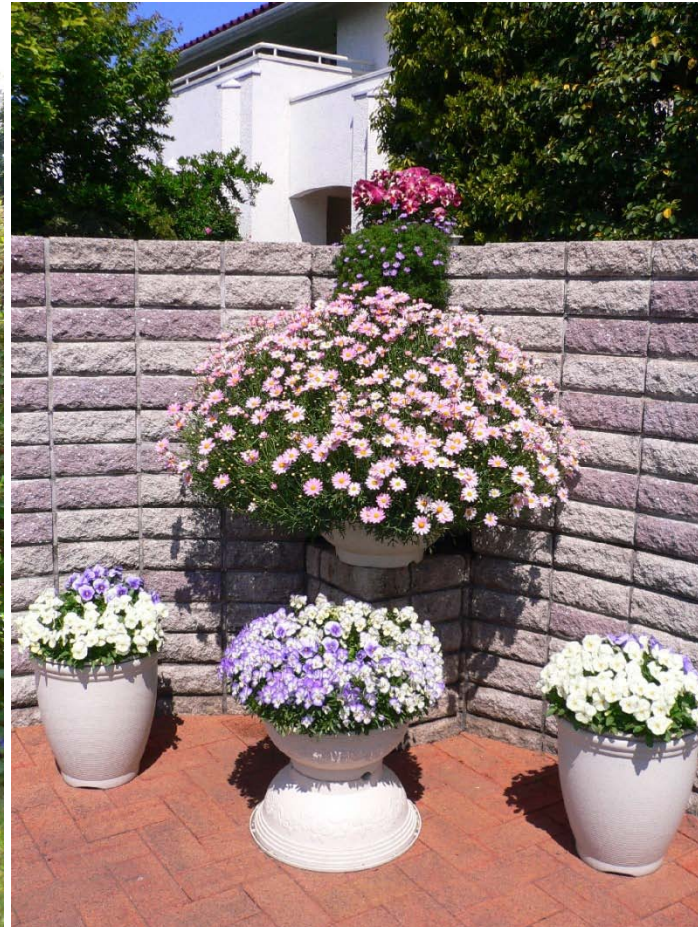
育成後展示した生花