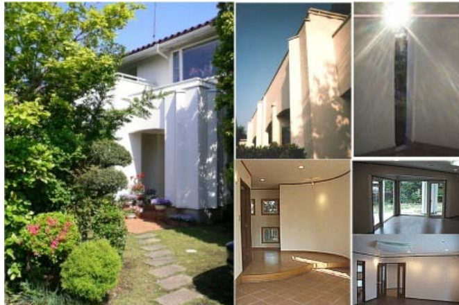
←1997年完成のリゾートオフィス

1997年に完成した湘南リゾートオフィスはそれなりに心血を注いでデザインしたものであったので、かなり満足はしていたのであるが、建築物に付随した外構を臨時のものとしていたため、外構はいまひとつ満足のいくものではなかった。