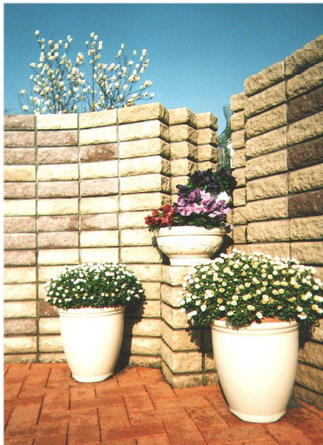
逆雁行式スリット