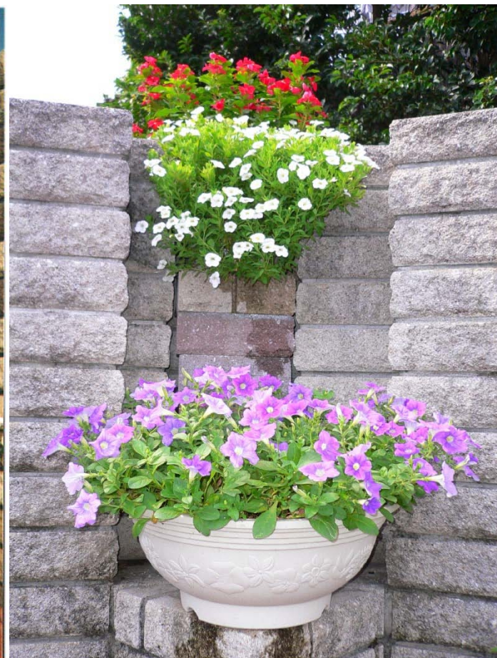
三角形のせり出し舞台；メイン生花用