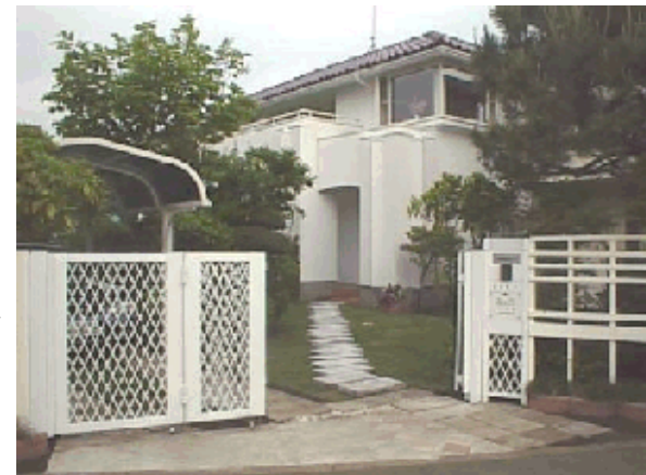
1997年当時の仮づくりの外構→

「湘南リゾートオフィス」と称するからには、それに相応しい外構が不可欠である。そこで、オフィス完成後5年の歳月を経て、納得のできる外構のデザインコンセプトの構築とデザインングに挑戦した。