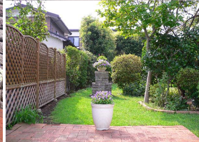
上；門塀全体イメージ、下；門からの眺め