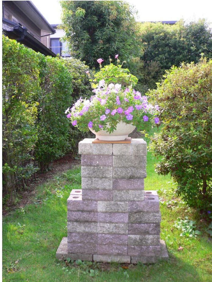
ゲート正面のピラミッド生花台