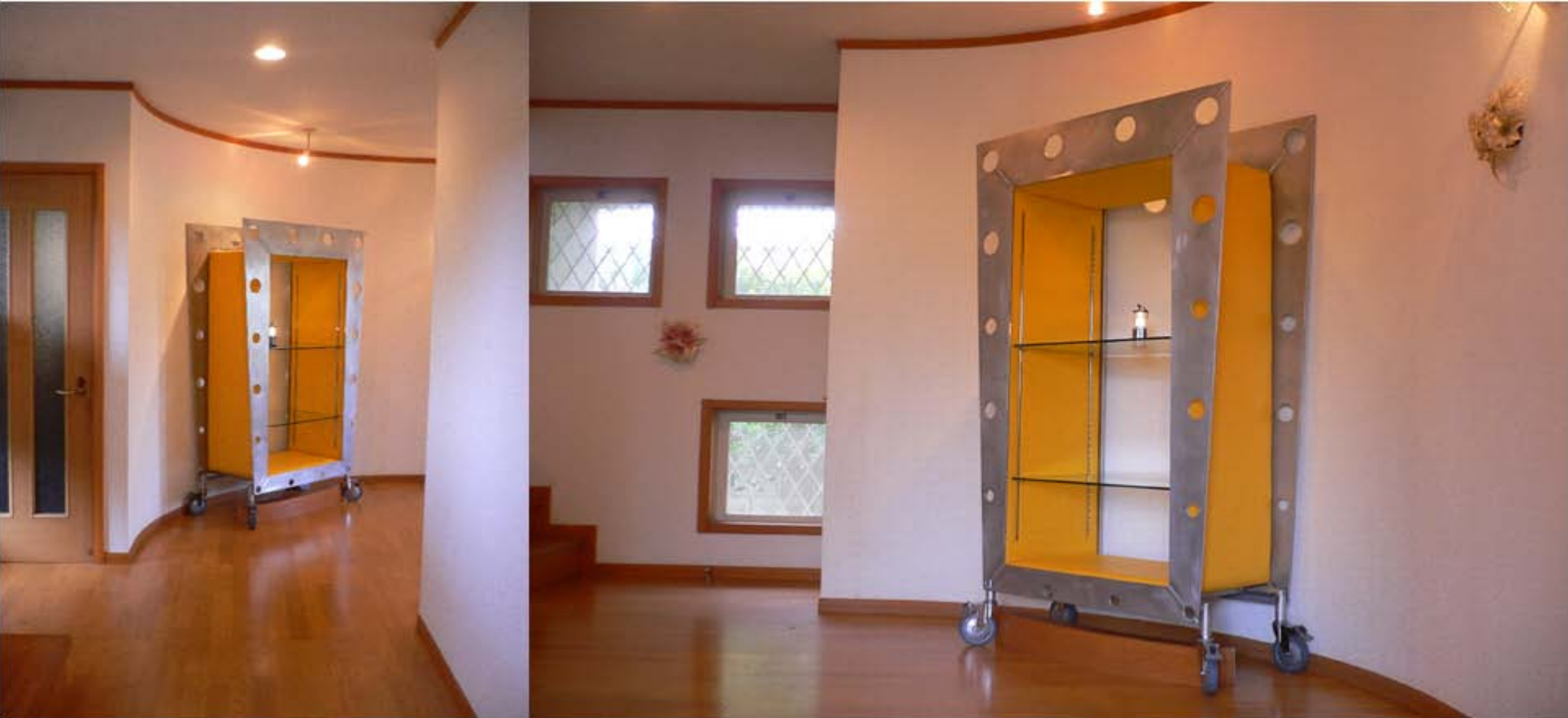
ステンレススチール材とパイプ構造の可動式ショーケース ; リサイクル品の再活用 製作2010