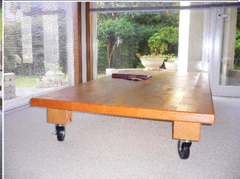
超低座卓脚部；脚柱とキャスター