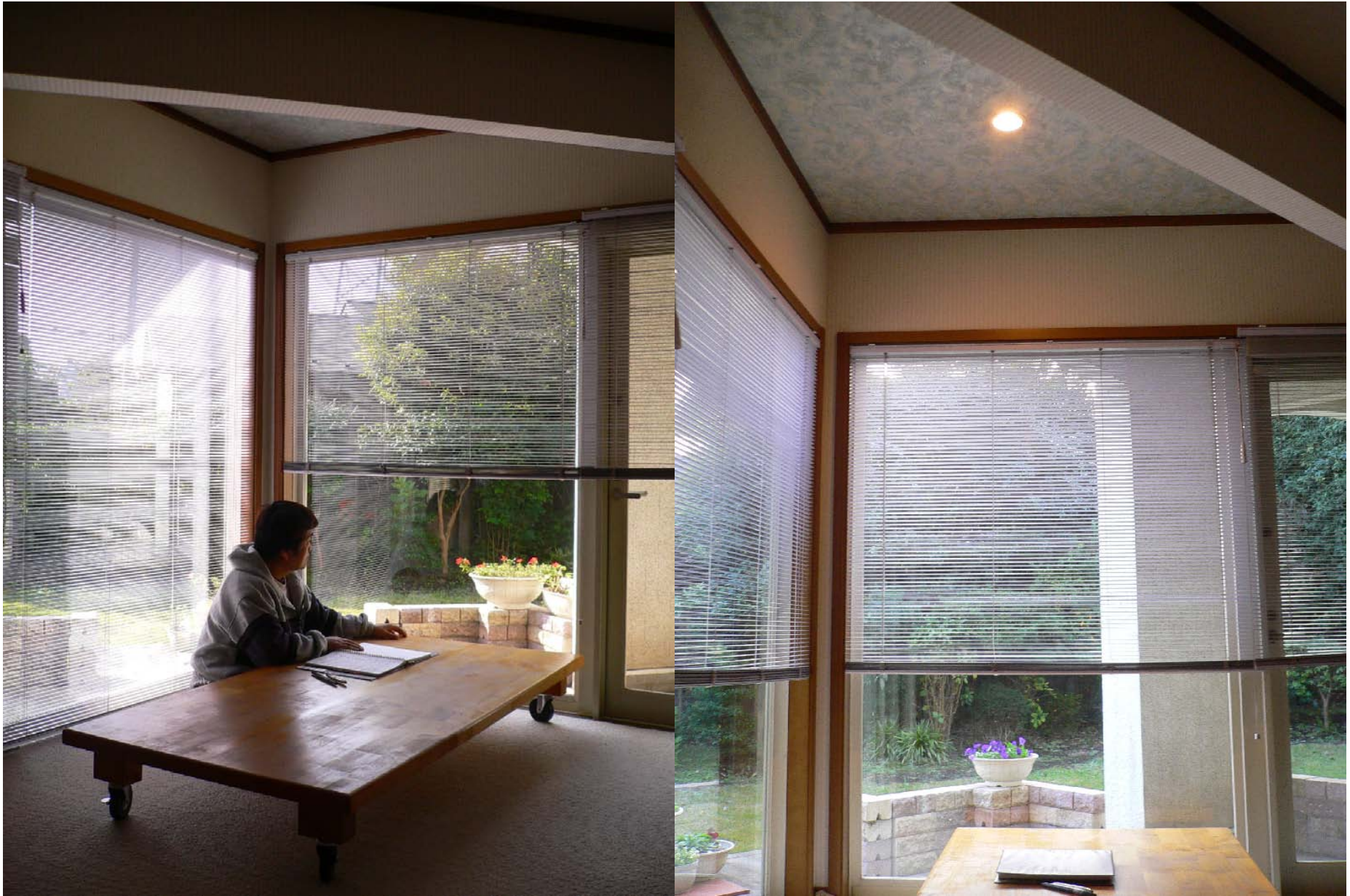
床座と超低座卓、南側張り出し部の先に“月見台”