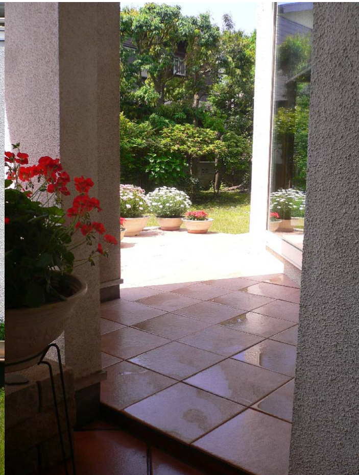
1Fデッキへの張り出し部左側；玄関アプローチより