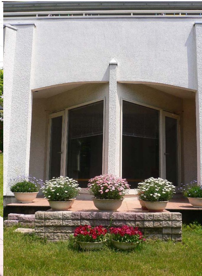
南面庭より見たDEN外観、手前は“月見台”