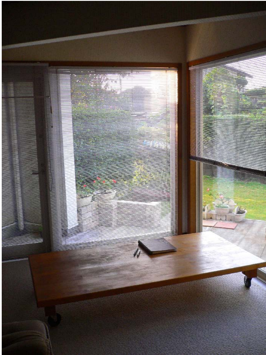
超低座卓とブラインド、4.5帖ベージュフロアカーペット