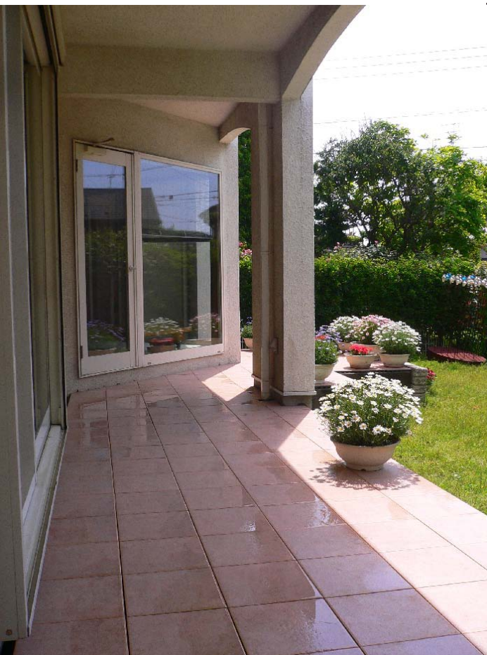
1Fデッキへの張り出し部右側