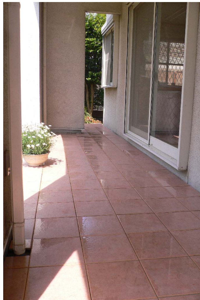
『遊縁』はTOTO製陶器パネルタイル300角のはめ込みにより設置。隅切り部分は全てグラインダーによるカット。